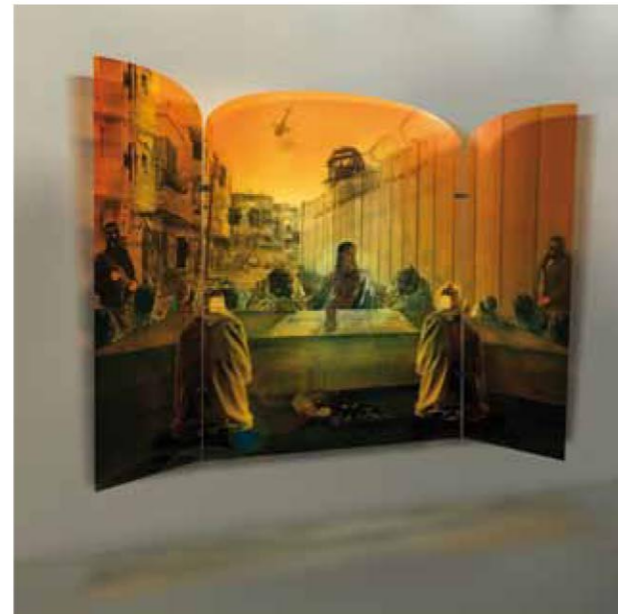
Yves Hayat, Altar "Ama a tu vecino como a ti mismo" | "Love your neighbor as yourself" altarpiece (2014). Impresión de tinta sobre 3 paneles de Plexiglás transparente | inkjet print on 3 transparent Plexiglass panels, 200 x 150 cm.