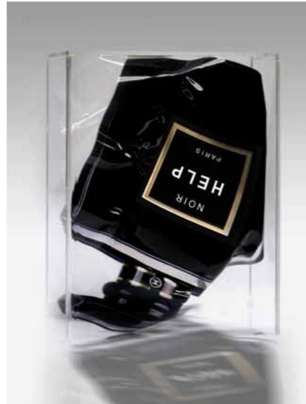
Yves Hayat, Ideas negras (Socorro) | Idées noires (Help) (2013). C-print color sobre película transparente quemada y envasada en caja de Plexiglás / C-color print on transparent film, burnt and enclosed in Plexiglass box, 40x30x10 cm, ed: 3. © Hayat 2013 | Mark Hachem Gallery.

I admit that I'm more interested in manipulating reality than in recording it. My artwork can be situated between photography, installation and Narrative Figuration . Using superimpositions, shifts, misappropriations, I confront past and present, luxury and violence, indifference and fanaticism. Through a strictly artistic approach, I try to express a philosophical thought, not in complicated words but by speaking to our senses, in a clear, un-tortured way. I present the essence of our human condition and of our time, bringing out its distinctive characteristics and its violence. The titles I give to my works, utterly hijacked advertising slogans, have the effect of giving a meaning to the pollution of our everyday lives. They reveal our identity and display our own brand. Not a celebration of barbarity, but rather the fascination created by human ambivalence.